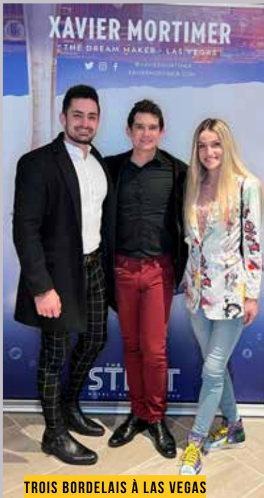
TROIS BORDELAIS À LAS VEGAS