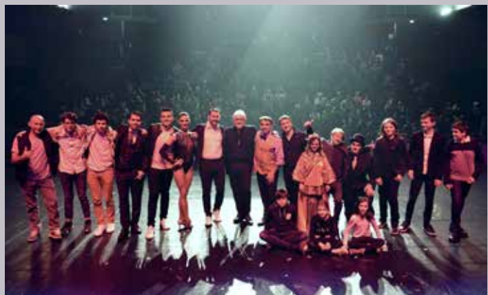
LE CMA EN ACTION

Photo du haut : une conférence qui réunit de nombreux participants.